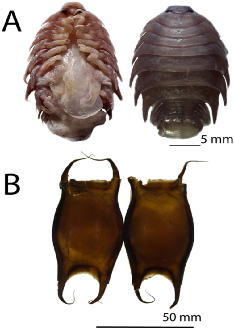
Fig. 3. Ejemplar hembra de Nerocila acuminata (A) asociados a las cápsulas ovíferas de Rostroraja texana (B)