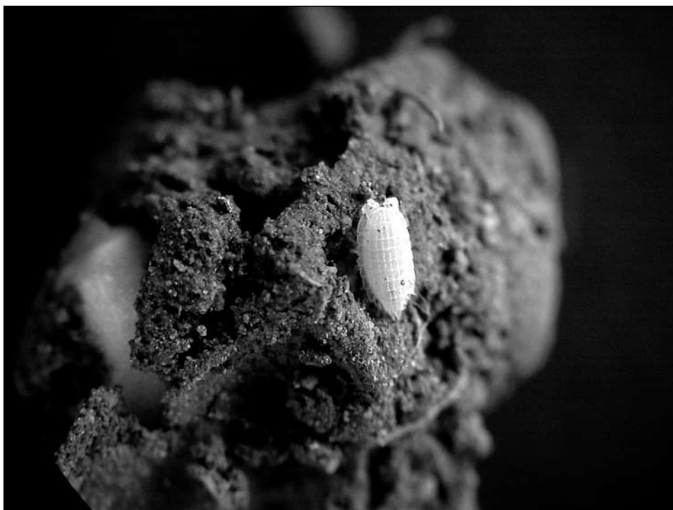
Figura 2. Platyarthrus schoeblii . Habitual en els formiguers de la Vall.

Costa d'en Flassada, 12-11-2000. Única localitat d'aquesta espècie a Mallorca. Citada també a Eivissa.