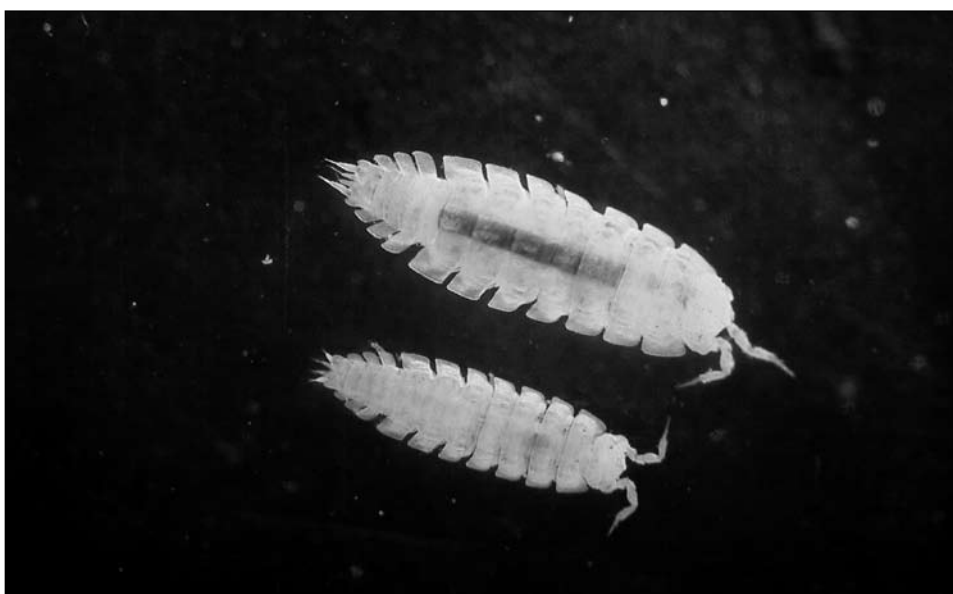
Figura 1. Exemplars d' Haplophthalmus danicus del Coll de Sóller.

Espècie cavernícola endèmica de Mallorca. A la Vall s'ha localitzat únicament a la cova dels Estudiants, on és bastant abundant sobre restes de fusta en descomposició. A més d'aquesta cova de Sóller, únicament es coneix en d'altres quatre cavitats: cova de Can Sion (Pollença); cova de les Rodes (Pollença); cova de Sa Cometa des Morts (Escorca) i avenc de Travessets (Artà).