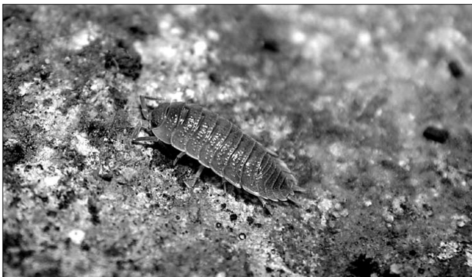
Figura 5. Porcellio incanus , comú a alzinars, zones arbrades humides i entrada de coves.

Espècie de muntanya de distribució beticorifenya. Molt característica de les zones pedregoses de la serra de Tramuntana. Fins ara no s'ha citat a Menorca ni tampoc a Formentera, però sí a Cabrera i a la Dragonera.