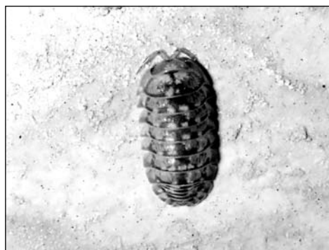
Figura 10. Armadillidium cruzi , exemplar de sa torre Picada.

Barranc de Biniaraix, 1-04-1997; camí de Muleta de Ca s'Hereu, 10-11-1996; 17-11-1996; camí de Rocafort, 31-10-2004; camí de s'Arrom, 22-12-1996; camí de ses Tres Creus, 4-11-1996; pla de sa Serp, 26-09-1998; puig de ses Tres Creus, 1-02-1996; 23-10-1995; 13-12-1995; ses Llemes, 21-10-1996.