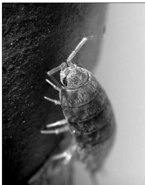
Figura 4. Porcellionides fuscumarmoratus , espècie de muntanya, freqüent a la Serra.