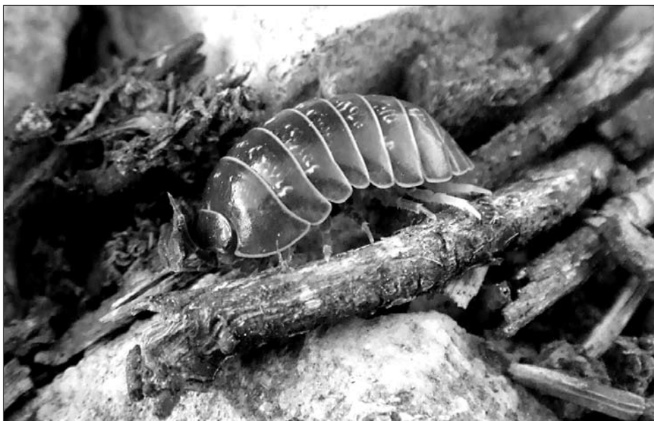
Figura 9. Armadillidium vulgare , exemplars de Cúber.

Armadillidium granulatum és una espècie expansiva litoral, però no halòfila. A Mallorca es troba estesa pràcticament per tota l'illa essent especialment abundant i característica de zones amb enderroc originats per activitat antròpica. Present a totes les illes.