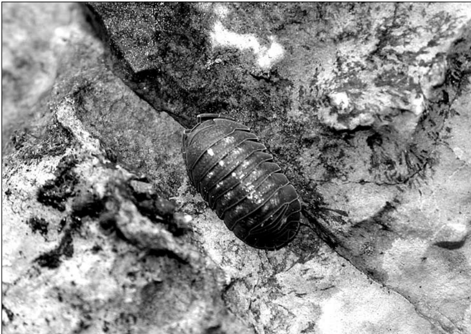
Figura 8. Armadillidium granulatum , exemplar del polvorí dels Cingles.