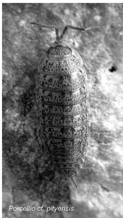
Figura 6. Porcellio aff. pityensis , exemplar de Bàltx d'Enmig.