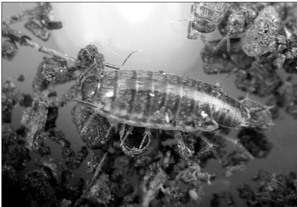
Figura 3. Chaetophiloscia elongata , exemplars del port de Sóller.

Petita espècie litoral que viu molt a prop de la mar, normalment associada a restes vegetals dipositades sobre les platges. Citada com Armadilloniscus littoralis , per Garcia i Cruz (1993). Única localitat fins ara a Mallorca. També a la Dragonera (Garcia, en premsa) i a Eivissa.