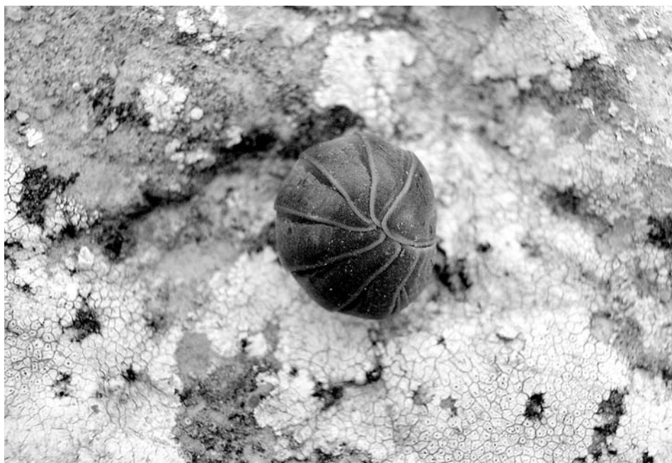
Figura 11. Armadillo officinalis , espècimen de Muleta.

Espècie endèmica de la serra de Tramuntana i la Dragonera, que va ser identificada per primera vegada l'any 1996 a la vall de Sóller, on és especialment abundant a les zones càrstiques de muntanya baixa (Garcia, 2003). És una espècie molt interessant que presenta característiques morfològiques que suggereixen una adaptació al clima típicament mediterrani subhúmit, propi de la Vall, amb fortes temperatures i insolació estivals i elevada humitat hivernal. Fins ara no hem localitzat mai una femella portadora d'ous o embrions.