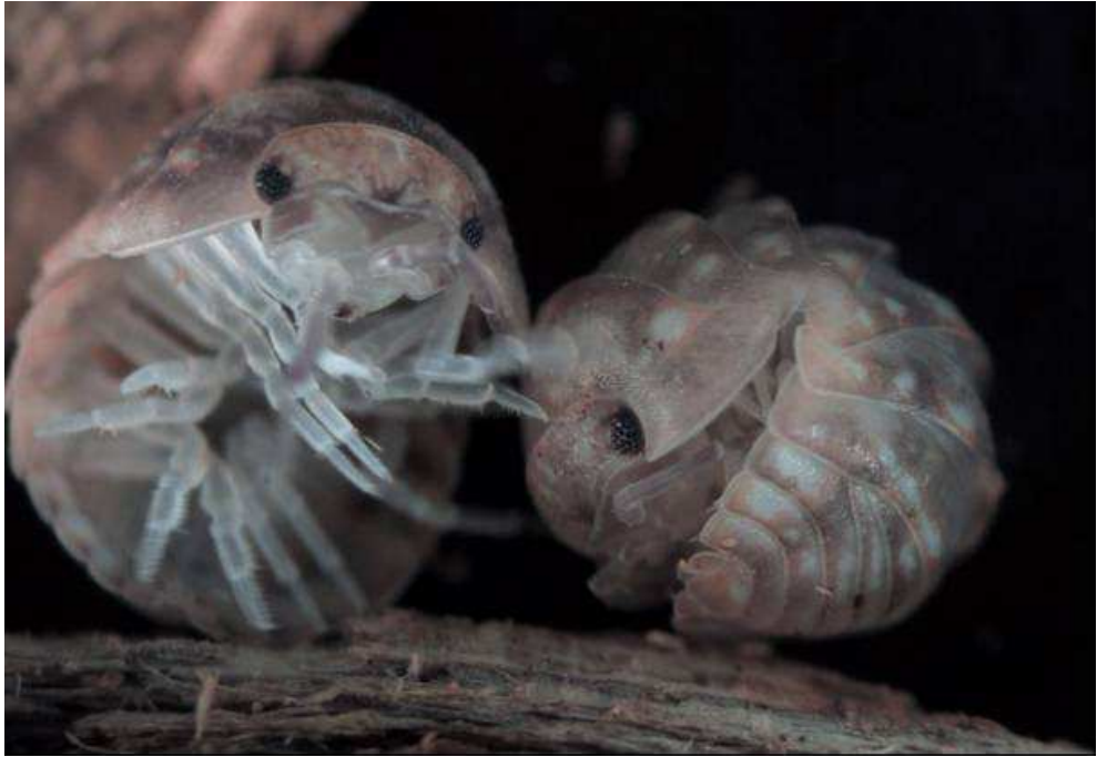
Fig. 2. Armadillidium cruzi Garcia, 2003. Exemplars de sa Dragonera.

Fig. 2. Armadillidium cruzi Garcia, 2003. Specimens from sa Dragonera.-