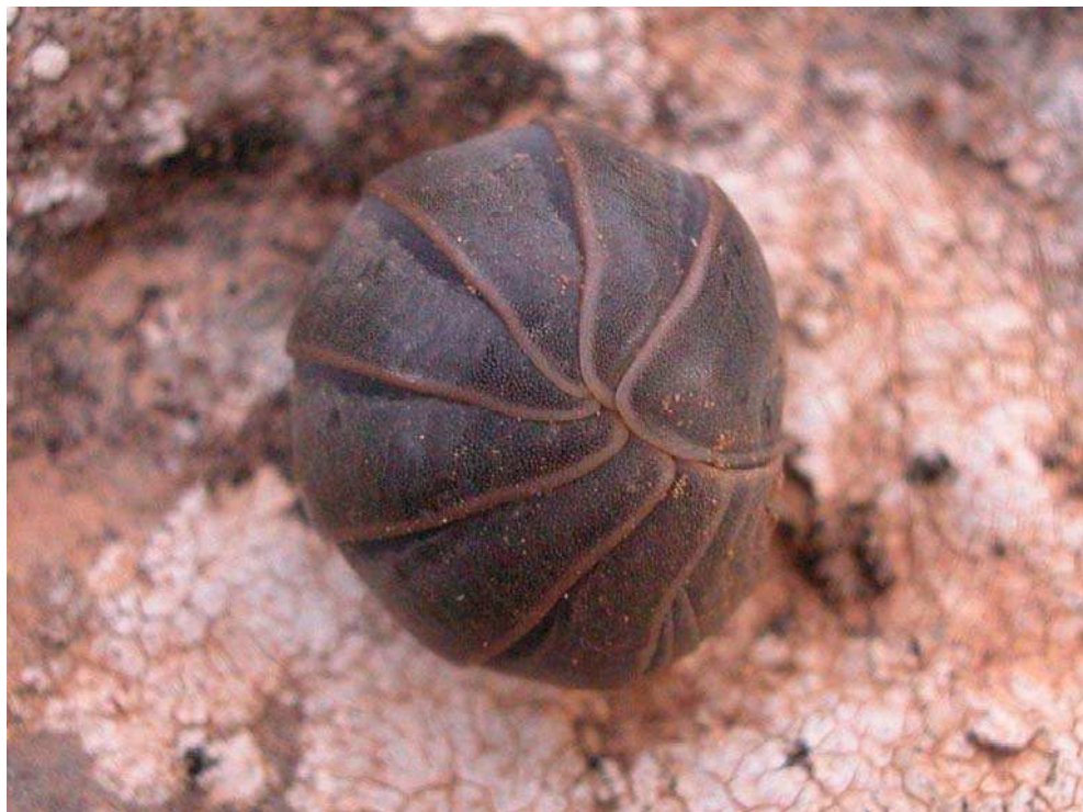
Fig. 4. Armadillidium officinalis . Exemplars de sa Dragonera. Fig. 4. Armadillidium officinalis . Specimens from sa Dragonera.

d'alguns exemplars de mida gran de sa Dragonera, ha mostrat una composició que en un gran percentatge està formada per restes d'artròpodes, seguit de matèria vegetal i partícules minerals. A les Balears, Armadillo officinalis , és una de les espècies més abundants tant en lloc humanitzats com dins el medi natural, ocupant igualment les zones de pinar com d'alzinar alterat i garrigues. També s'ha localitzat a l'entrada de coves.