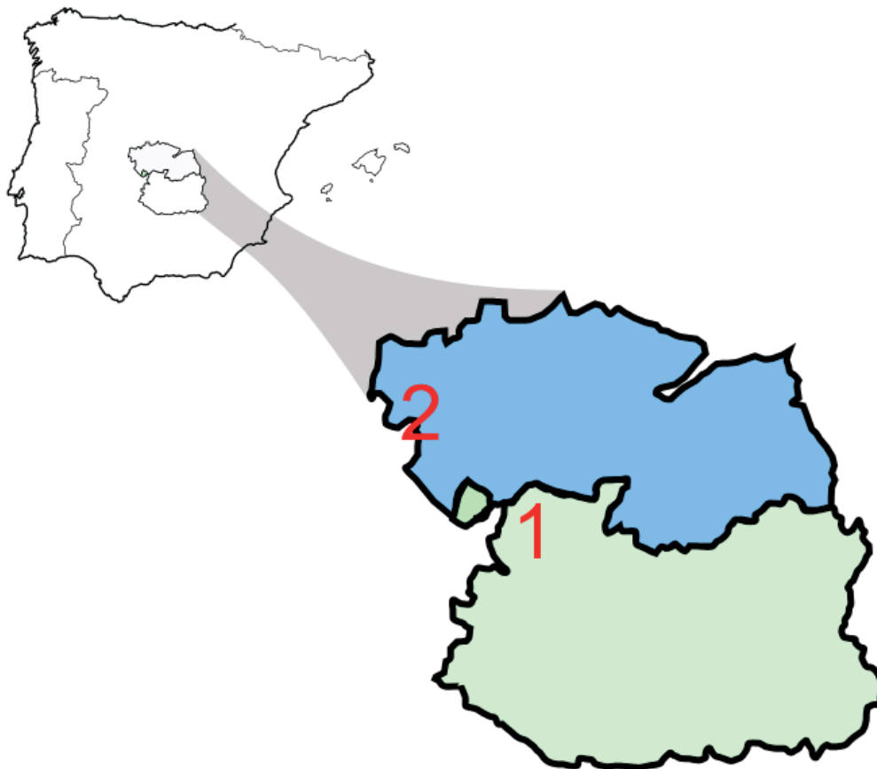
Fig. 1. Mapa de situación en la península ibérica de Castilla La Mancha: Ciudad Real (verde), Navas de Estena (1). Toledo (azul), Puente del Arzobispo (2).