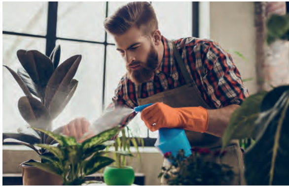
Aaltjes mengen met water, roeren, sproeien. Klaar!