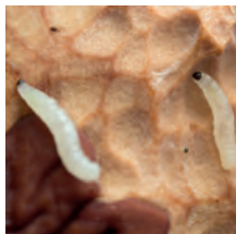
Larve van de varenrouwmug

De varenrouwmug, ook rouwvlieg, dondervliegje, humusvlieg, zwarte vlieg of mosvlieg genaamd is een zeer klein (3 mm) zwart mugje met lange antennes op haar kop, dat traag en wankel vliegt (niet te verwarren met fruitvliegjes, die ongeveer even groot zijn).