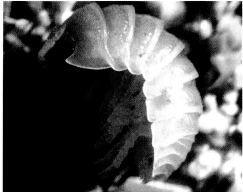
Fig. 3. Armadillidium album . Exemplar de S'Albufera de Mallorca.

Fig. 2. Es Comú beach, hàbitat of Armadillidium album in the Albufera Natural Park.