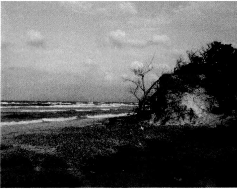
Fig. 2. Platja d'Es Comú, hàbitat d' Armadillidium album al Parc Natural de s'Albufera.

Fig. 2. Es Comú beach, hàbitat of Armadillidium album in the Albufera Natural Park.