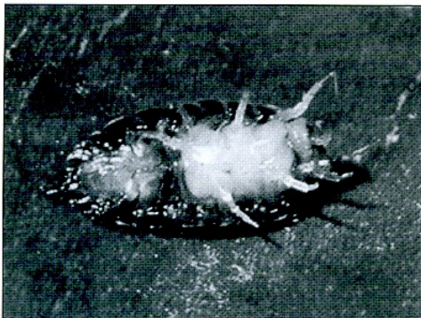
Pissebed met larven.