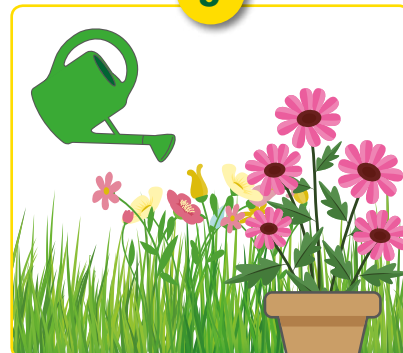
Giet of sprei over gazon, siertuin, blad, boom of in potten.