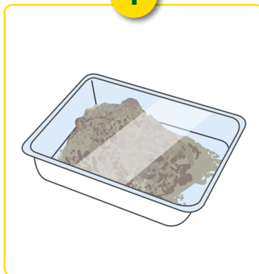
Bakje met aaltjes.