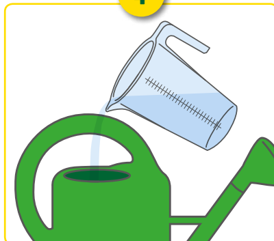
Verdeel het concentraat.