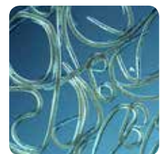
Aaltjes 400x vergroot

Bij een bodemtoepassing van aaltjes vermenigvuldigen de aaltjes zich in het plaaginsect. Ze zorgen zo voor een nieuwe generatie aaltjes die vervolgens op zoek gaat naar de rest van de plaaginsecten. Hoe beter aaltjes zich kunnen verspreiden, hoe effectiever de werking. Overdoseren is geen probleem. De hoeveelheid aaltjes neemt pas af als de plaag niet meer aanwezig is, de bodem te droog wordt of wanneer de bodem- of omgevingstemperatuur te laag wordt.